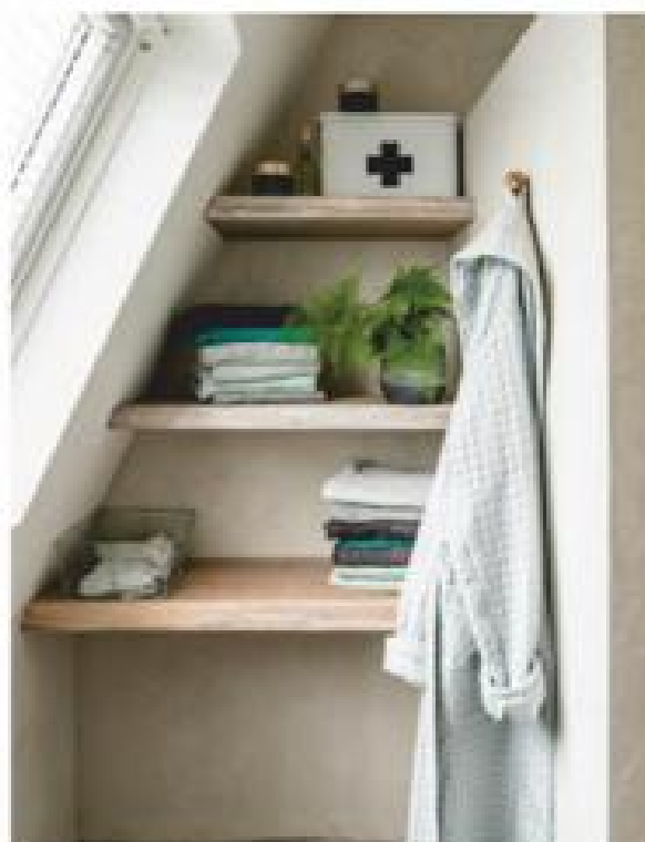
De bovenverdieping wilde Hinefa graag een romantisch tintje geven. Vandaar de roze muren in de slaapkamer. In de kleine badkamer zijn alle muren en hoekjes benut door planken en haakjes op te hangen.