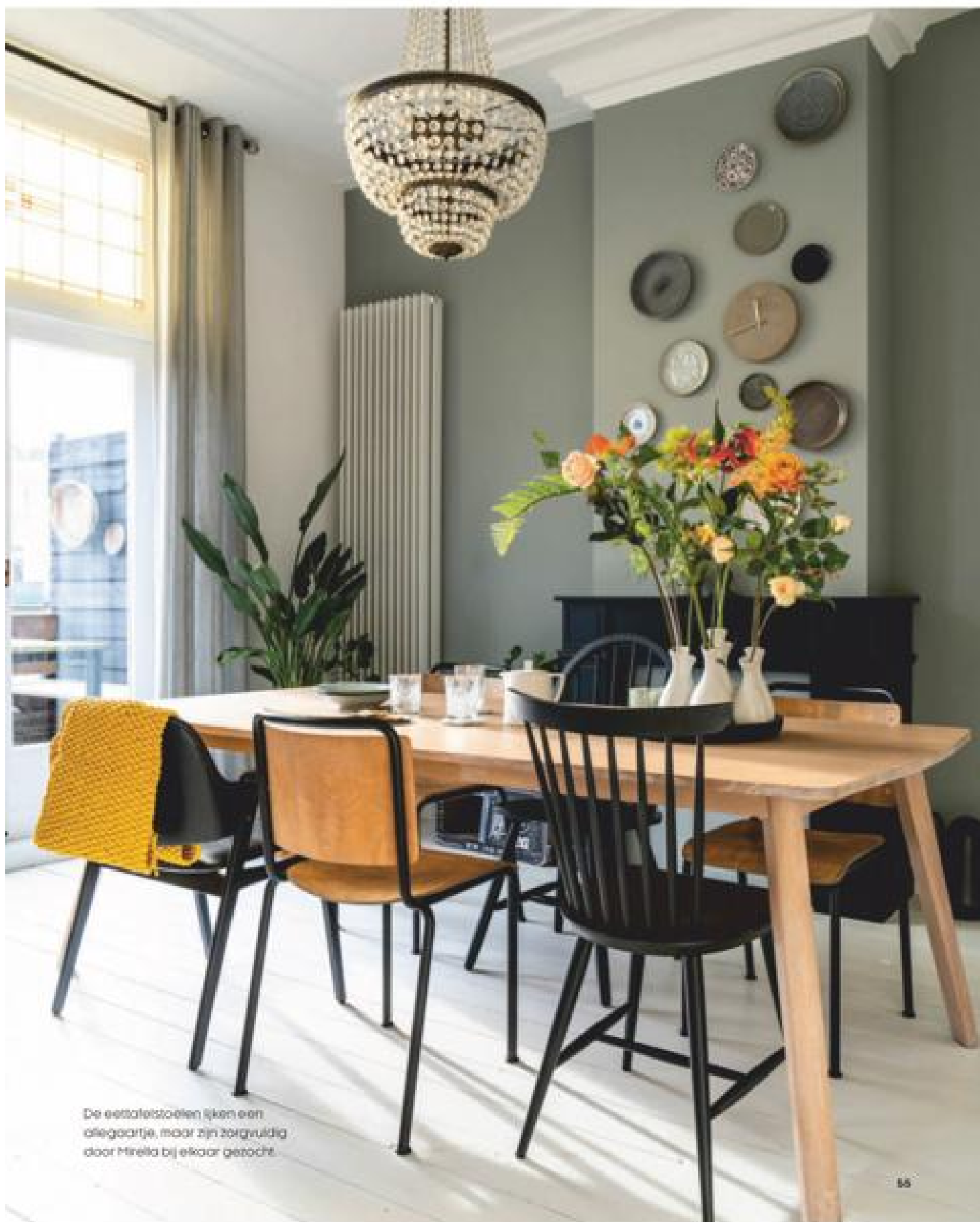
De eetstoelen lijken een allegaartje, maar zijn zorgvuldig door Mirella bij elkaar gezocht.